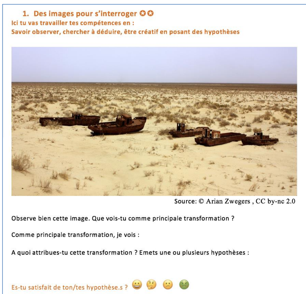
Fig. 5 : Deuxième fiche destinée aux élèves de la ressource Transformations : à qui appartient l'eau

Les élèves sont informés des compétences qu'ils vont exercer au travers de ce travail. Comme pour la fiche précédente, une autoévaluation est demandée. Cette dernière oblige les élèves à se poser la question de la qualité de leur réflexion, mais également à prendre conscience de ce qu'ils sont en train d'apprendre. Une situation métacognitive qui participe pleinement à « apprendre à apprendre » et développe par la même occasion des compétences émotionnelles qui, à termes devraient aider les élèves à prendre confiance en leur propre capacité à apprendre.